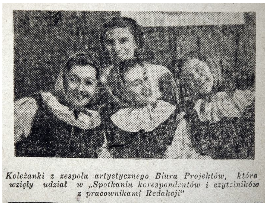
Koleżanki z zespołu artystycznego Biura Projektów, które wzięły udział w „Spotkaniu korespondentów i czytelników z pracownikami Redakcji”