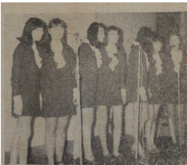
Śpiewają dziewczęta z zespołu „Mini-Rytm“.