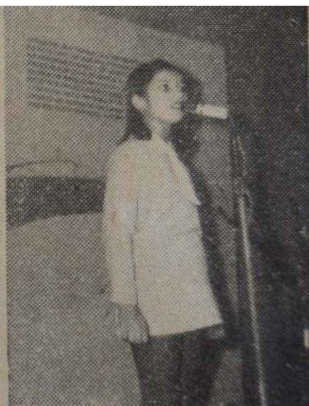
Występ małej solistki.