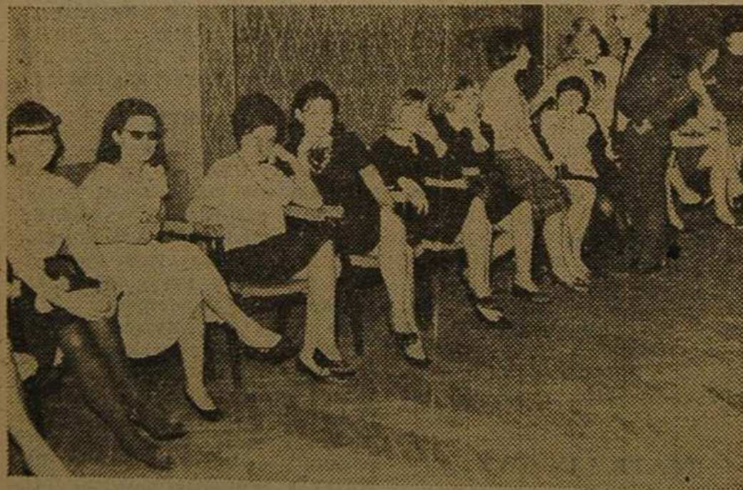
Po tańcu należy się trochę wytchnienia.