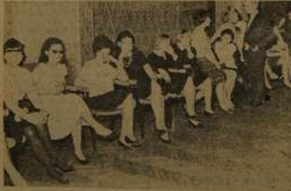
Po tańcu należy się trochę wytchnienia.