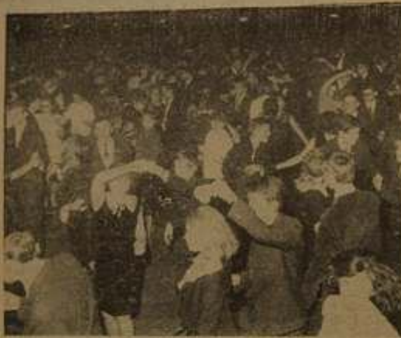
Tańczone wisły, przeważnie trw. „motyłka” — ulubiony taniec młodzieży.

To rok 1966 r. Nowohucka studniówka!! Jak się kurde tańczyło motyłka?