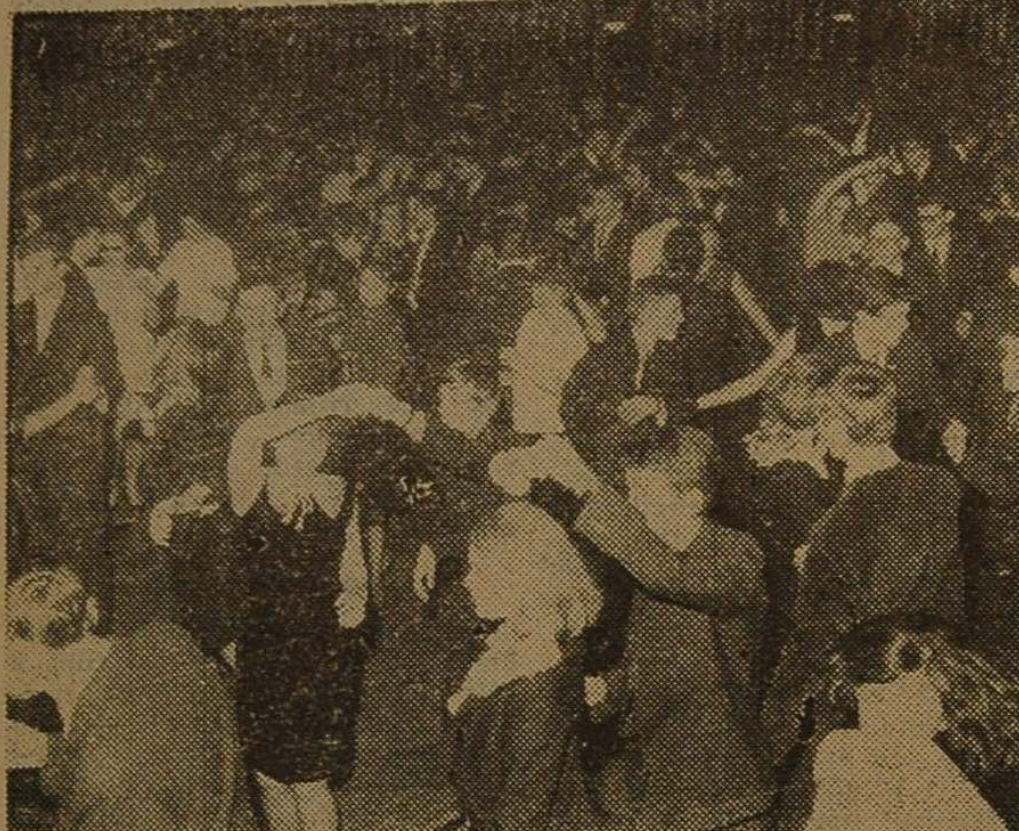
Tańczono wiele, przeważnie tzw. „motylka” — ulubiony taniec młodzieży.