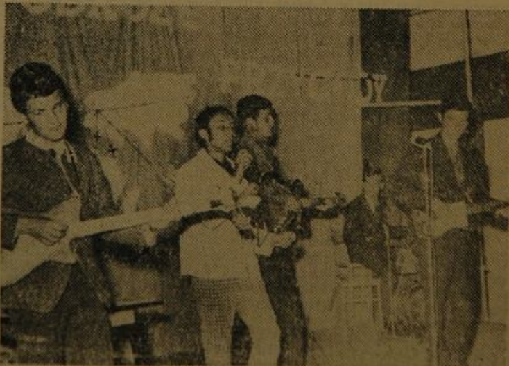
W części artystycznej „finału finałów” wystąpili soliści i zespół gitarowy z Domu Kultury Budowlanych. (Szczególnie polebało się zebranym widowisko pt. „Na krakowskim Rynku”).

Co to było za big-beatowe widowisko „Na krakowskim rynku”? To rok 1969.