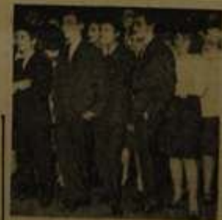
Wskazujące schyłek balu konkursowa grupa solistów.