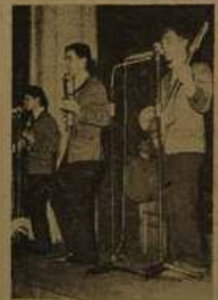
Grały „Huragany” (na zdjęciu) i zespół gitar elektrycznych — „Zefiry”.