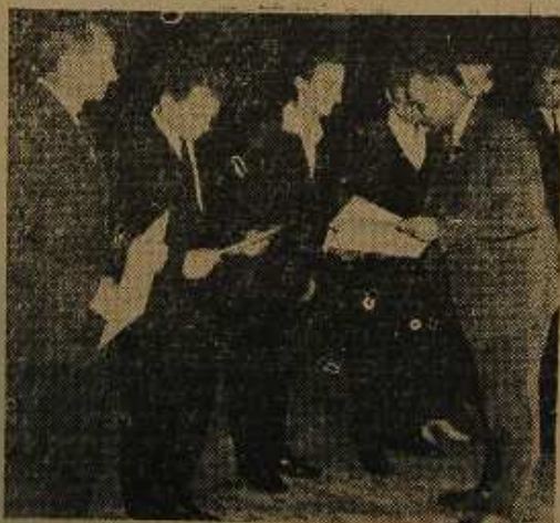
Gra amatorski zespół muzyczny Walcowni Gor.