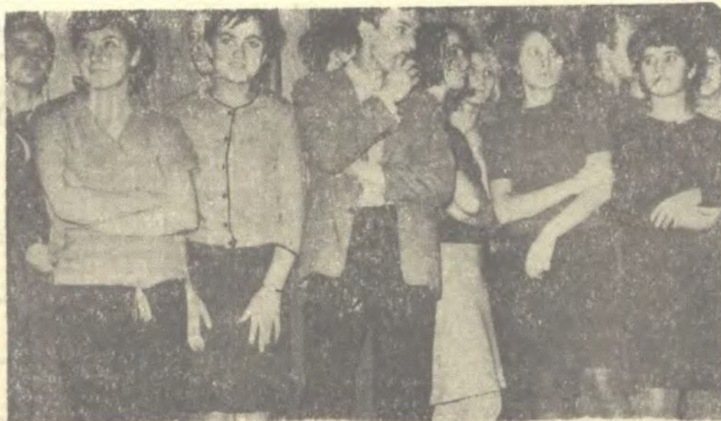
Głos Nowej Huty 1962, nr 51, s. 3

* Kierownictwo Klubu Turystów zawiadomia, że przy wejściu do tego lokalu prawdopodobnie znów obowiązować będą karty wstępu. Jest to konieczne ze względu na przesiadującą tu stale młodzież szkolną, która niejednokrotnie zamiast zająć się lekcjami, spędza długie wieczory przy telewizorze i czarnej kawie. Niezależnie od wprowadzenia kart, sprawą tą powinny zainteresować się komitety rodzicielskie. (ba)