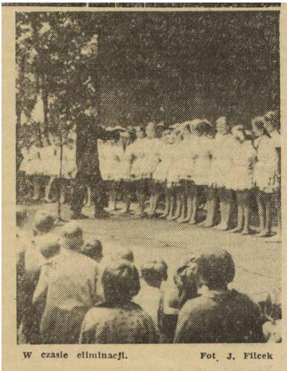
W czasie eliminacji.