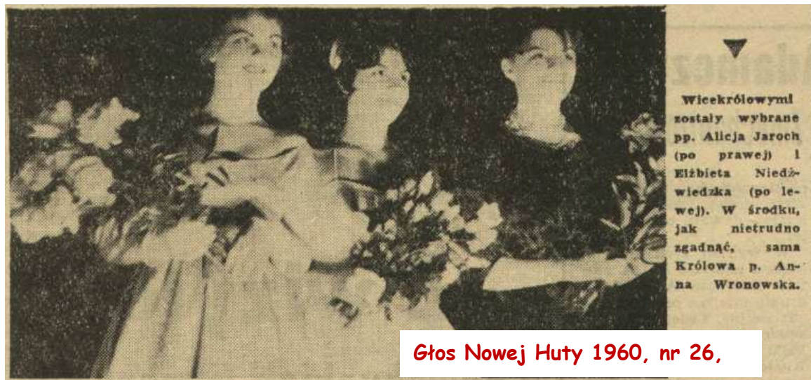
Głos Nowej Huty 1960, nr 26,

Na sali zrywa się burza oklasków, Są też dowody niezadowolenia, ale czyż może być inaczej w podobnych sytuacjach?! Królowa i jej