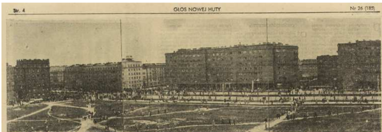
Głos Nowej Huty 1960, nr 26, s. 4, 25 czerwca - 1 lipca

Na koniec zagadka - panorama jakiego to osiedla nowohuckiego jest?