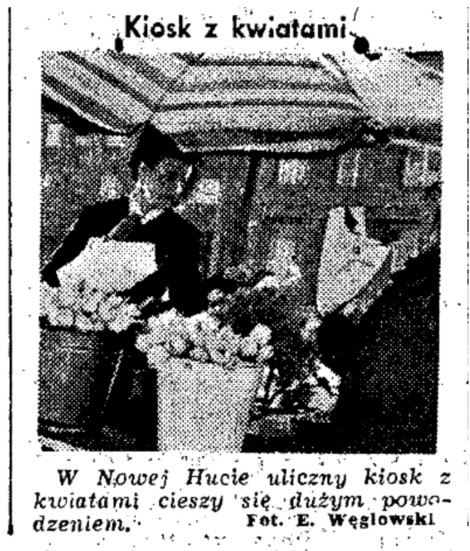
W Nowej Hucie uliczny kiosk z kwiatami cieszy się dużym powodzeniem.

Próba przeniesienia krakowskich kwaciarek na Plac Centralny? I kto wie, czy kiedykolwiek Plac Centralny miał nazwę Plac Stalina? Mnie się wydaje (na podstawie dostępnych i znanych mi źródeł), że od zawsze to Plac Centralny!